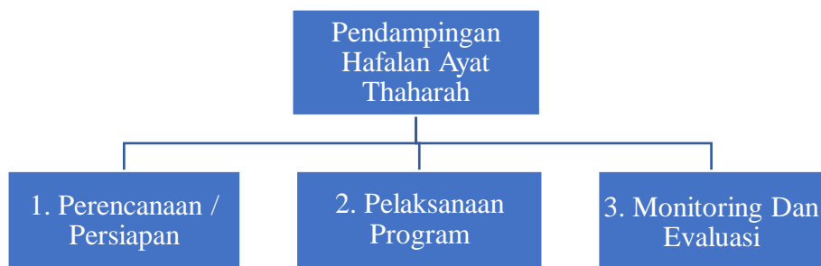
Bagan 1. Skema Pelaksanaan Pendampingan Hafalan Ayat Thaharah

Dalam pelaksanaannya, PAR terdiri dari tiga tahapan utama yang mendukung kelancaran program pendampingan tahfidz di SDIT Al-Asror, yaitu (Yusuf, A, (2020) : pertama, tahap persiapan, pendamping merencanakan kegiatan, mengelompokkan siswa berdasarkan kemampuan, dan menyiapkan materi hafalan; kedua, tahap pelaksanaan, yaitu proses menghafal yang dilakukan secara terstruktur dengan bimbingan aktif dari pendamping; dan ketiga, tahap evaluasi, yang bertujuan menilai kemajuan siswa, memberikan umpan balik, serta menentukan langkah perbaikan untuk tahap berikutnya. Dengan mengikuti ketiga tahapan ini, program pendampingan dapat berjalan efektif, partisipatif, dan menyesuaikan dengan kebutuhan serta kemampuan masing-masing peserta didik.