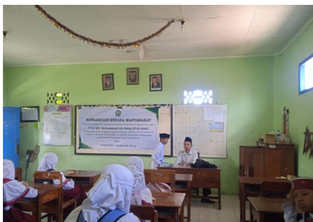
Gambar 1. Pelaksanaan PkM