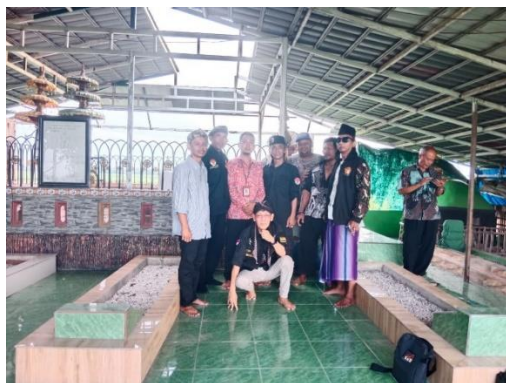
Gambar 1 : Daftar Nama Makam Di Komplek Situs Kunitir