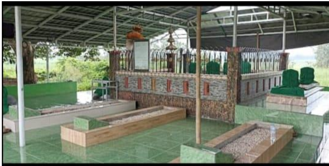
Gambar 11 : Makam Sebelum Di Bongkar