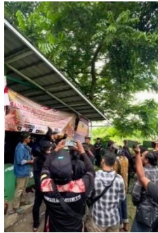
Gambar 9 : Upacara Pra Pembongkaran