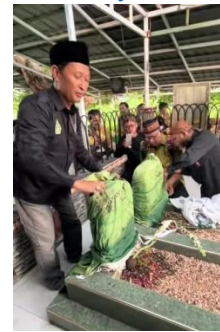
Gambar 10 : Proses Pembongkaran