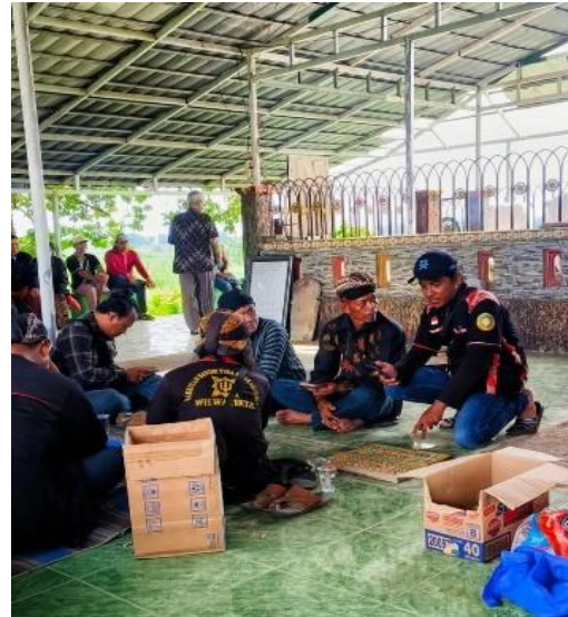
Gambar 5 : Patriot Sawunggaling

Kemudian Kami melaporkan temuan ini kepada Kepala Desa dan Kepala Dusun Bendo Kunitir Jatirejo Mojokerto Jawa Timur untuk di tindak lanjuti. Akhirnya pada hari Senin tanggal 7 Januari Kami dapat undangan musyawarah yang bertempat di Balai Desa Kunitir bersama Kepala Desa, Kepala Dusun, Ketua MWC NU Jatirejo, Sekdes Kunitir, Ketua BPD Desa Kunitir, PWI LS Mojokerto, PDG dan Patriot Sawunggaling, setelah dilakukan pembahasan dan diskusi terhadap materi atau topik rapat, selanjutnya seluruh peserta musyawarah menyetujui dan memutuskan beberapa hal yang berketepatan menjadi keputusan akhir dari musyawarah yaitu :