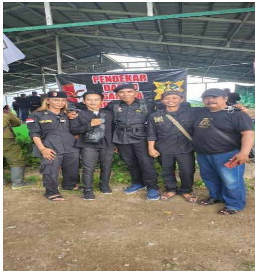
Gambar 4 : PDG ( Pasukan Darah Garuda )