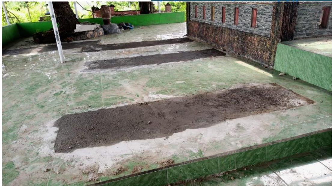
Gambar 12 : Makam Sesudah Di Bongkar

Dan Pasca pembongkaran makam–makam palsu yang ada di kumitir masyarakat sekitar merasakan dampak positif yang luar biasa,diantaranya :